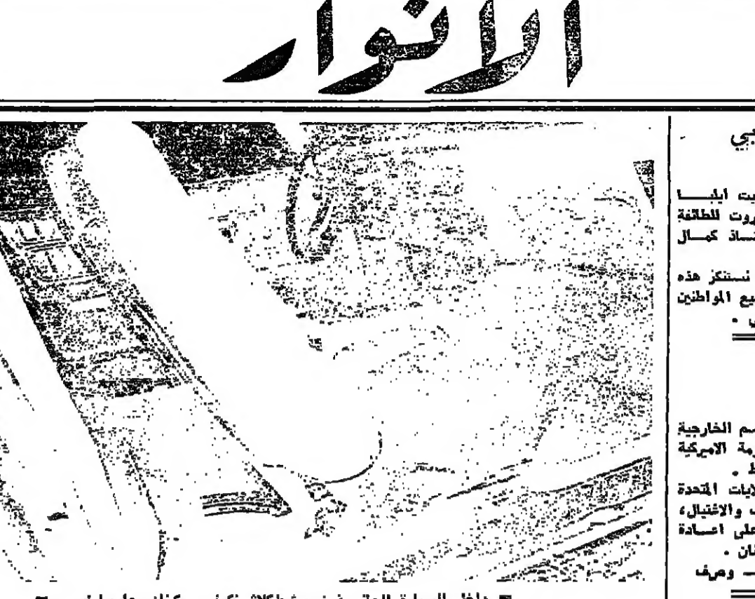
داخل السيارة الجنائية : مخطط كاشيفوت وسكينان وعليها رابين

دعوة شركة امين بازرجي وأولاده كلاسيكاً لنسياناً - سوبارو - سوزوكي ماتكوب المزاولتها الكبار للاحضور أو الامتثال بمكاتب الشركة في السعودية بحسب معمولات الماسية بتأنيب الجدياء « الفهمان » لتسوية اوضاعهم المالية من مستندات وورقهن وغيرها . ولطائفة تفرغها الكبار عن وصول سيارات جيبية موديل ٧٢ ان المكاتب تعمل من الساعة صباحاً حتى الساعة بعد الظهر ٢٦٤٨٠٠ / ٢٦٤٨٠٠ / ٢٦٤٨٠٠